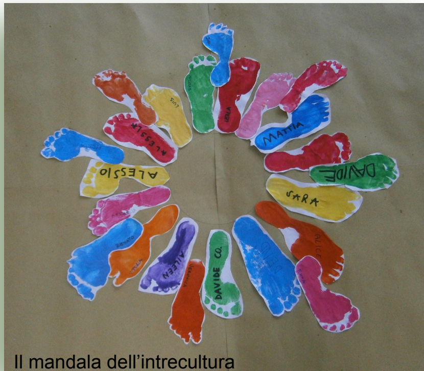
Il mandala dell'intreccatura